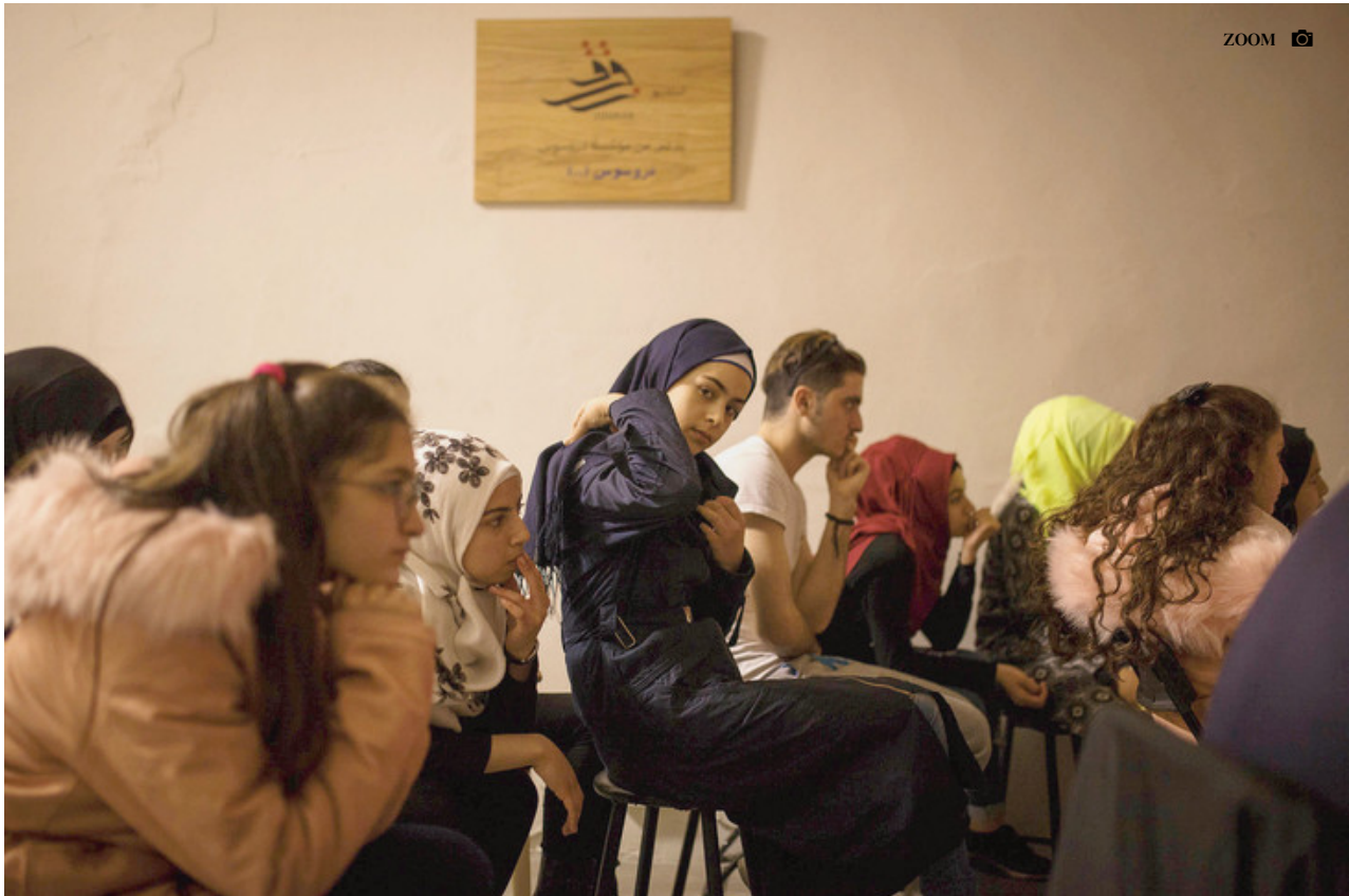
Jeunes libanais et syriens dans leur atelier de théâtre organisé par la compagnie libanaise Zoukak.

Objectif: renforcer leur maturité émotionnelle face à la violence du quotidien.